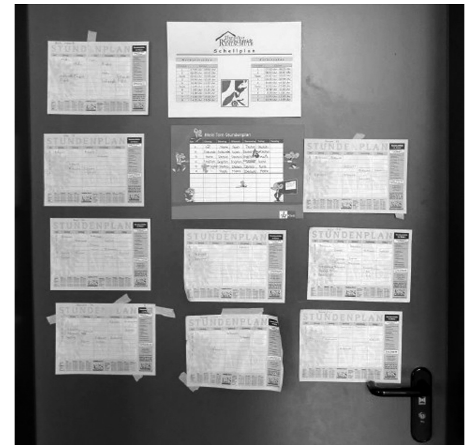
Henrichs 2014, 6

Bereits in Regelklassen kann von Unterricht im Gleichschritt kaum die Rede sein, für internationale Klassen ist die Situation noch dramatischer: In vielen der entsprechenden Modelle trifft wohl die Aussage zu, dass alle Schüler_innen