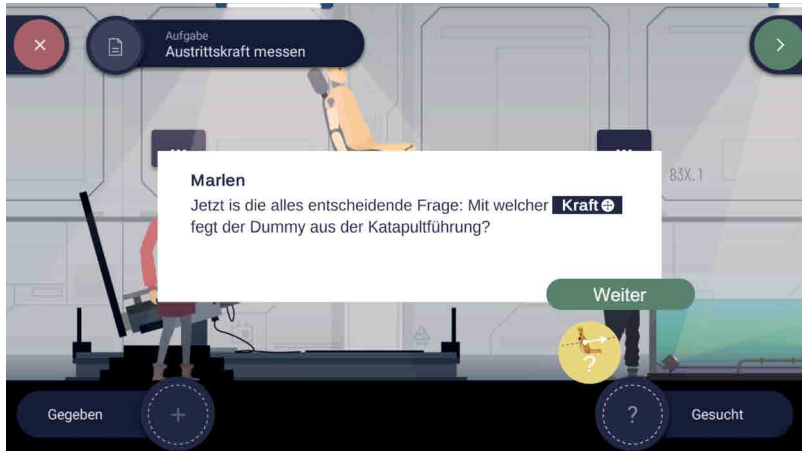
Abbildung 2: Realbereich des Aufgabenraums mit offenem Dialogfenster, aus dem die Informationen in die Ablagen gezogen werden können

Des Weiteren besteht die Möglichkeit, notwendige Informationen mittels eines Analyse-Tools zu identifizieren. Das bedeutet, dass die Spieler/innen durch Interaktion mit der Spielwelt die notwendigen Werte direkt an der dazugehörigen Stelle im Objekt suchen und dann angezeigt bekommen. Dies verringert den Abstraktionsgrad von Informationen und dem dazugehörigen z.T. alltäglichen Objekt und fördert das Verständnis. Das zu dem Wert dazugehörige Objekt wird darüber hinaus auch in der Symbolik abgebildet (siehe Abb. 2 unten links), um die Verknüpfung in späteren Bearbeitungsschritten aufrechtzuerhalten.