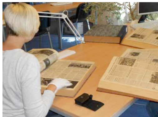
Abbildung 3: Archivarbeit, Stadtarchiv Siegen