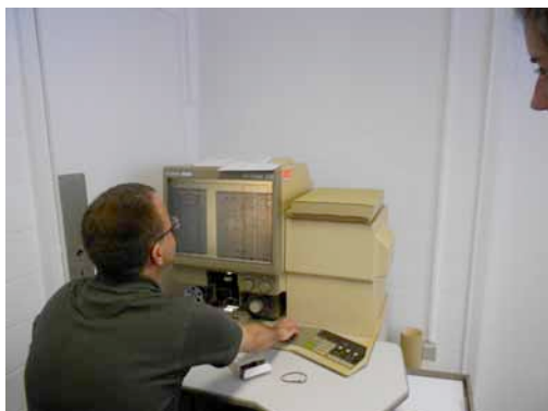
Abbildung 2: Archivarbeit, Archiv Siegener Zeitung

Anhand konkreter, vorab recherchierter Daten, besonders stadthistorischer Ereignisse, sichteteten und untersuchten wir exemplarisch die beiden Zeitungsbestände dahingehend, inwiefern diese entscheidende Ereignisse, wie zum Beispiel der erste Spatenstich für den Neubau des Siegener Gefängnisses im Unteren Schloss im Jahr 1930, die erste Besichtigung durch den Landrat und den Oberbürgermeister im Jahr 1931 oder die Auflösung der Frauenabteilung im Jahr 1971, in den Lokalnachrichten behandelten. Die Sichtung der ausgewählten Zeitungen war insofern gewinnbringend, als wir dadurch eine Vorstellung von dem Ausmaß der Thematisierung, beziehungsweise Nicht- Thematisierung, des Siegener Gefängnisses in lokalen/regionalen Printmedien erhielten. Hinsichtlich unseres eigentlichen Forschungsgegenstandes – dem Diskurs über kriminelle Frauen und die dadurch geprägten Bilder und Vorstellungen von normaler/anormaler Weiblichkeit – erwies sich die Zeitungsanalyse als weniger ertragreich: Über das Siegener Gefängnis wurde kaum berichtet, über die dort inhaftierten Frauen so gut wie gar nicht.